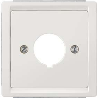
DELTA style Abdeckung titanweiß für Abdeckplatte für Einbau- Befehlsgerät, D=18,5mm