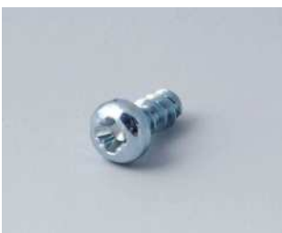
A0305031 Selbstformende Schraube 2,5 x 6 mm (PZ1)