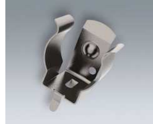
A9193035 Batterie-Clip Stahl vernickelt