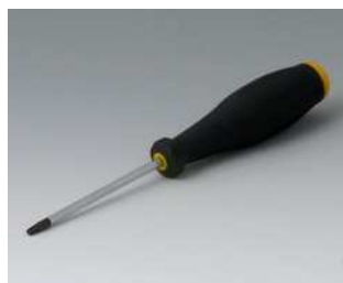
A0399T10 Torx Schraubendreher T10