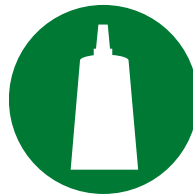
Konfektion / Montage