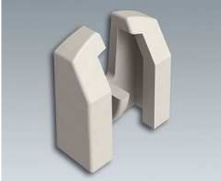
A9193033 Verpolungsschutz, Pluspol ABS (UL 94 HB) grauweiß RAL 9002