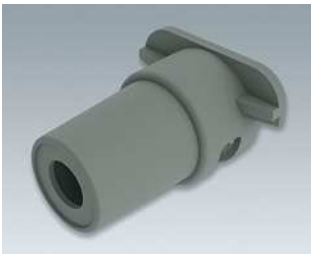
B2610101 Kabeltülle, 5,0 - 5,9 SEBS (TPE) vulkan