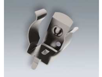
A9193036 Batterie-Clip Stahl vernickelt