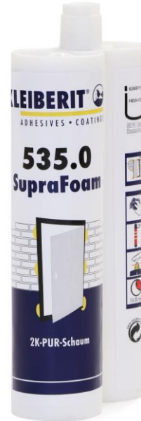
KLEIBERIT 535.0 SupraFoam in der Doppelkartusche