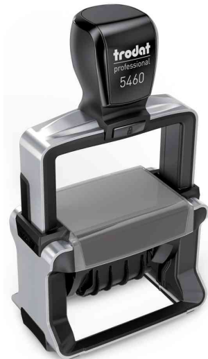
Datumstempel Professional 4.0 5460

Zubehör: Ersatzstempelkissen: Abgabe nur in ganzen VE's