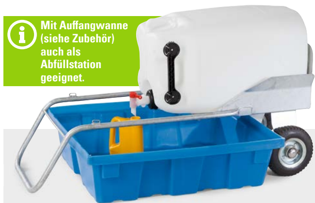
Typ PolySafe PSW 6.2, zum direkten Einstellen, Bestell-Nr. 107-262-J0

i Mit Auffangwanne (siehe Zubehör) auch als Abfüllstation geeignet.