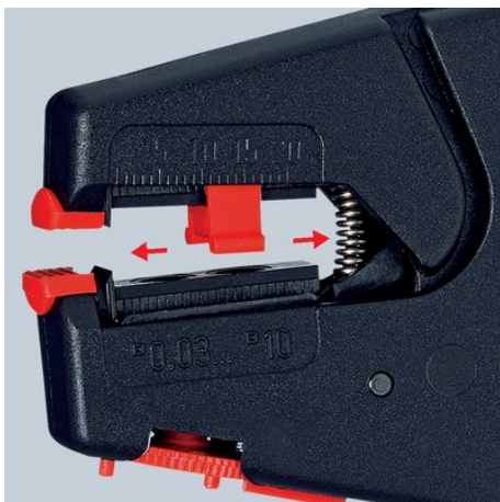
12 40 200: Tope longitudinal ajustable

Reservado el derecho a realizar modificaciones técnicas. Salvo error u omisión.