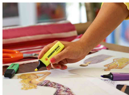
Visuel de référence : présente le produit en utilisation