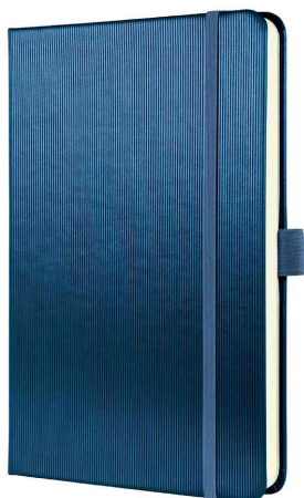
Visuel de référence : carnet de notes Conceptum, bleu métallisé