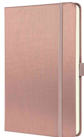
Visuel de référence : carnet de notes Conceptum, rose métallisé