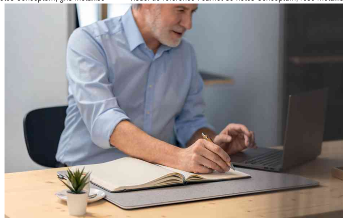
Visuel de référence : montre le produit en utilisation