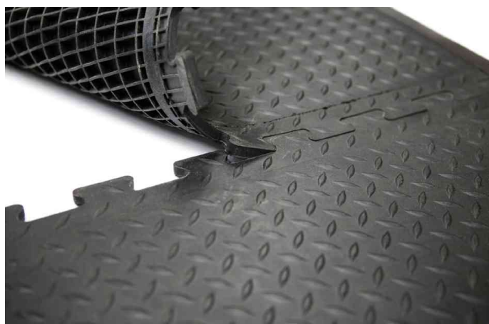
Visuel de référence: présente l'assemblage des tapis