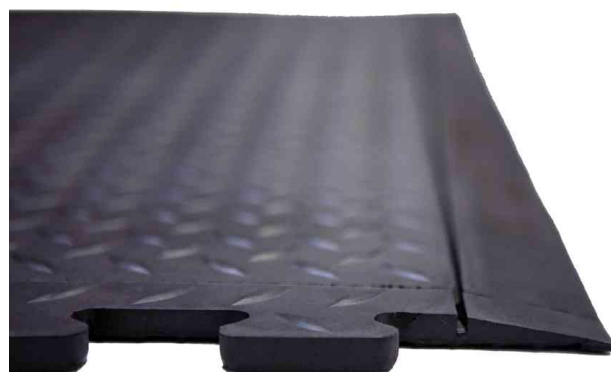
Visuel de référence: présente le bord biseauté