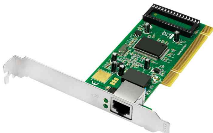
Carte PCI LAN Gigabit