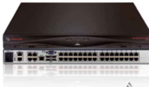
Avocent MergePoint Unity™-Switch (32 Ports)