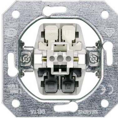
DELTA Geräteinsatz UP Taster 1W als Öffner einsetzbar ohne Krallen 10A 250V