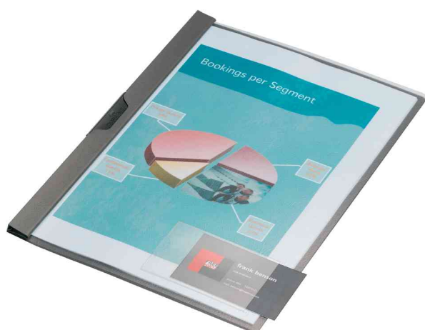
Pochette adhésive POCKETFIX®, exemple d'utilisation