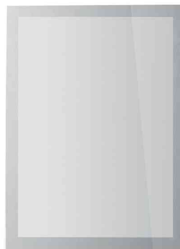
DURAFRAME SUN, silber