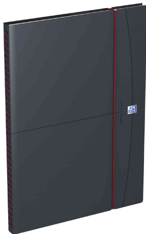
Agenda semainier "TEACHER", 210 x 297 mm