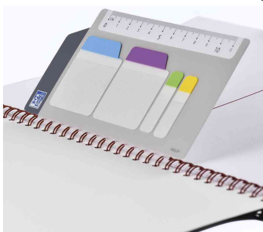
Agenda semainier "TEACHER", règle marque-page