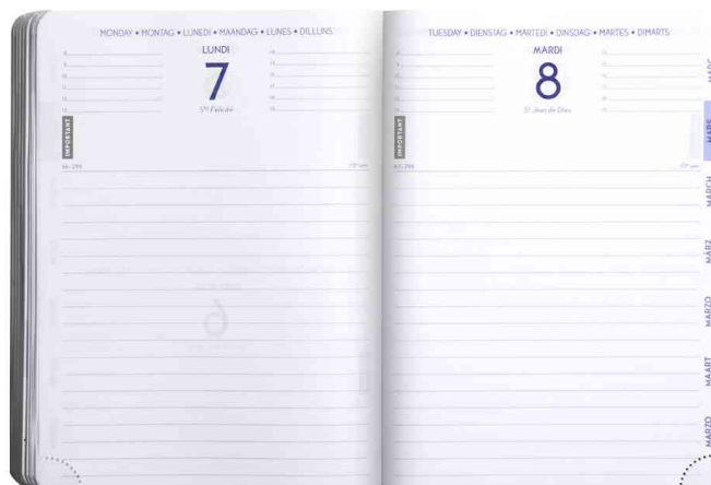
Grille Forum, détail