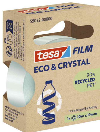
tesa Film® ECO & CRYSTAL, 19 mm x 10 m