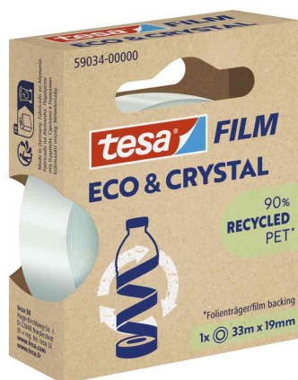
tesa Film® ECO & CRYSTAL, 19 mm x 33 m