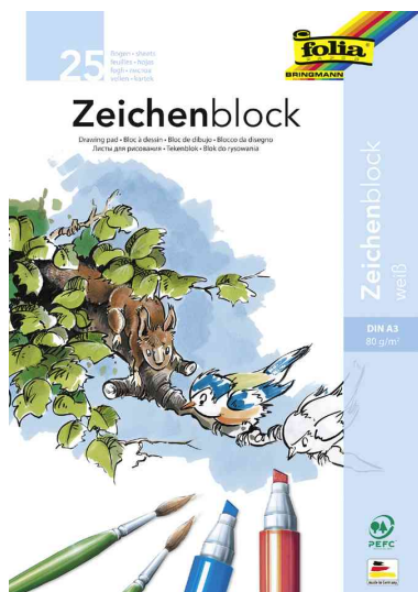
Bloc à dessin, A3