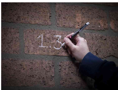
Visuel de référence : présente le produit utilisé sur la pierre