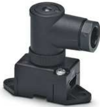
AS-Interface Verteiler in Schutzart IP67 für 1 Flachleitung, 2-polig, mit Schraubanschluss, gewinkelt

Bitte beachten Sie, dass die in diesem PDF-Dokument angezeigten Daten aus unserem Online-Katalog generiert wurden. Bitte finden Sie die vollständigen Daten in der Benutzer-Dokumentation. Es gelten unsere Allgemeinen Nutzungsbedingungen für Downloads.