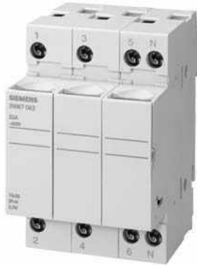
SENTRON, Zylindersicherungshalter, 10x38 mm, 3-polig, In: 32 A, Un AC: 690 V