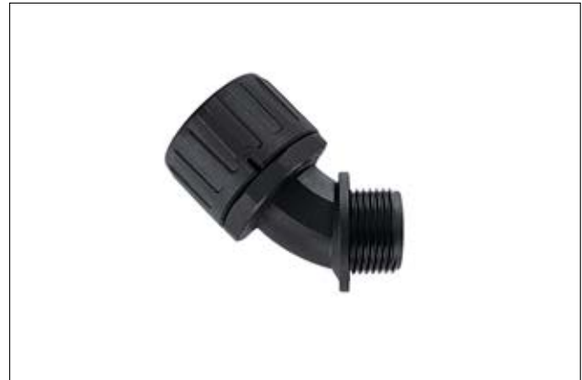
HeliaGuard HG-45 45°-Verschraubung mit Außengewinde.