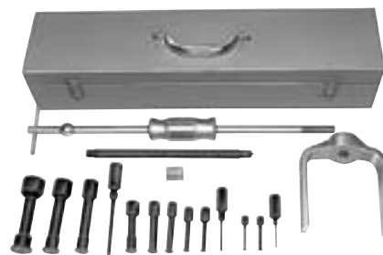
Satz Nr. 981

Der Spreizeinsatz wird durch die Bohrung des Werkstückes eingesetzt und anschließend mit dem Spreizdorn auseinandergetrieben, bis die Lippen des Spreizeinsatzes fest um das Werkstück greifen. Die Zugkraft wird entweder von einer Spindel mit Brücke oder einem Schlaghammer ausgeübt.