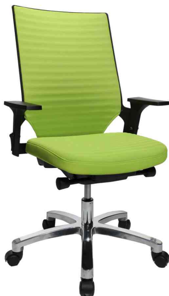
Bürodrehstuhl "Autosyncron 2", apfelgrün