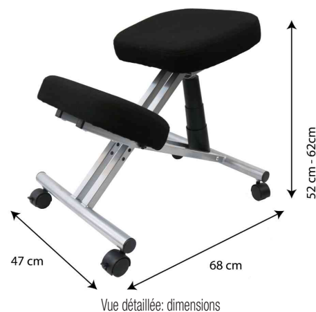
Vue détaillée: dimensions