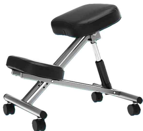
Tabouret ergonomique assis-genoux ERGO LEG