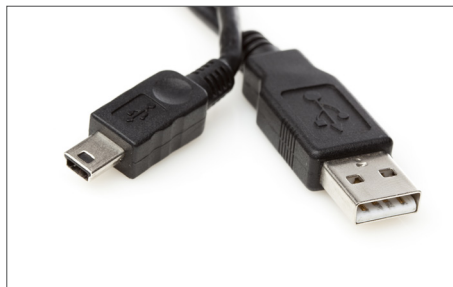
Safescan USB Update-Kabel Art. no: 112-0459