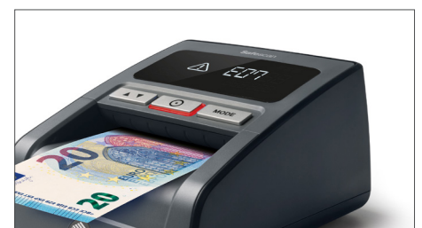
Akustisches und visuelles Alarmsignal