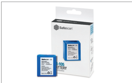
Safescan LB-105 Aufladbare Batterie Art. no: 112-0410