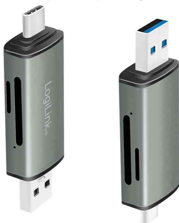
Lecteur de cartes USB 3.2 Gen1