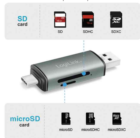
Visuel de référence: présente les cartes adaptées