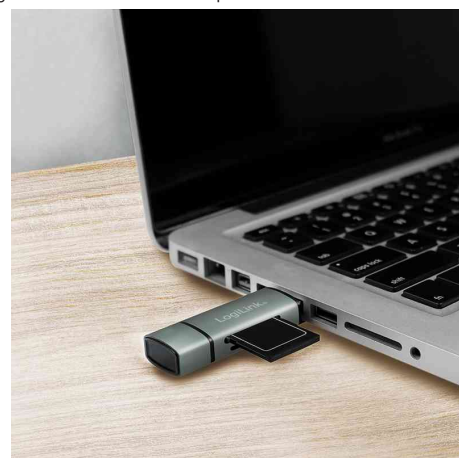
Visuel de référence: présente le produit en utilisation