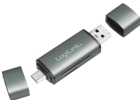
Lecteur de cartes USB 3.2 Gen1