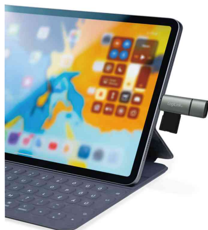
Visuel de référence: présente le produit en utilisation