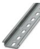
Tragschiene, Material: verzinkt, gelocht, Höhe 7,5 mm, Breite 35 mm, Länge: 2 m

Tragschiene - NS 35/ 7,5 ZN PERF 2000MM - 1206421