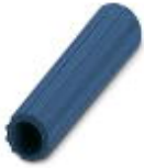
Isolierhülse, Farbe: blau