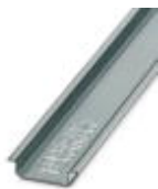
Tragschiene 35 mm (NS 35)

Tragschiene - NS 35/ 7,5 WH UNPERF 2000MM - 1204122