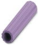
Isolierhülse, Farbe: violett