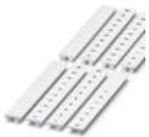
Zackband, bestellbar: streifenweise, weiß, beschriftet nach Kundenangaben, Montageart: Verrasten in hoher Schildchennut, für Klemmenbreite: 8,2 mm, Schriftfeldgröße: 10,5 x 8,15 mm

Marker für Klemmen - UC-TM 8 CUS - 0824597