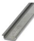
Tragschiene ungelocht, Breite: 35 mm, Höhe: 7,5 mm, Länge: 2000 mm, Farbe: silberfarben

Tragschiene ungelocht - NS 35/ 7,5 AL UNPERF 2000MM - 0801704