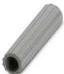
Isolierhülse, Farbe: grau