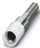
Prüfsteckerbuchse, Farbe: farblos

Prüfsteckerbuchse - PSBJ 4/15/6 FARBLOS - 0303419