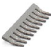
Einlegebrücke, Polzahl: 10, Farbe: grau