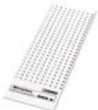
Kennzeichnungskarten, Karte, weiß, unbeschriftet, beschriftbar mit: Plotter, Montageart: Verrasten in hoher Schildchennut, Verrasten in flacher Schildchennut, für Klemmenbreite: 8,2 mm, Schriftfeldgröße: 6 x 8,1 mm

Kennzeichnungskarten - SBS 8:UNBEDRUCKT - 1007235