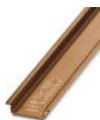
Tragschiene, Material: Kupfer, ungelocht, Höhe 7,5 mm, Breite 35 mm, Länge: 2 m

Tragschiene - NS 35/ 7,5 CU UNPERF 2000MM - 0801762