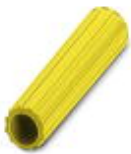
Isolierhülse, Farbe: gelb