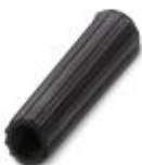
Isolierhülse, Farbe: schwarz