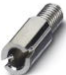
Prüfsteckerbuchse, Farbe: silberfarben