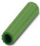
Isolierhülse, Farbe: grün