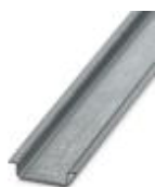
Tragschiene, Material: verzinkt, ungelocht, Höhe 7,5 mm, Breite 35 mm, Länge: 2 m

Tragschiene - NS 35/ 7,5 ZN UNPERF 2000MM - 1206434