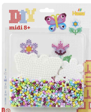
Perles à repasser "Papillon/petite fleur", sous blister

ATTENTION : ne convient pas aux enfants de moins de 36 mois en raison des petites pièces qui peuvent être avalées.