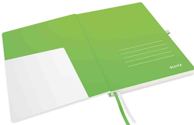
Innentasche im Vorderdeckel