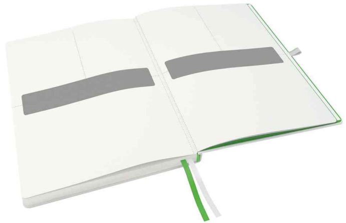
perforierte Blätter für Notizen