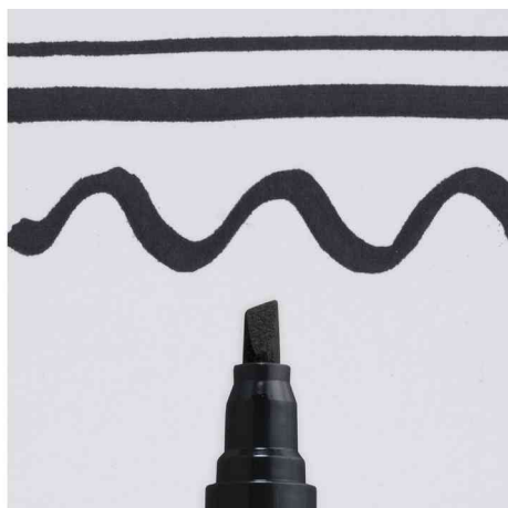
Largeur de tracé : 4,0 mm