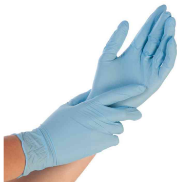
Visuel de référence: présente les gants bleus dans un distributeur en carton