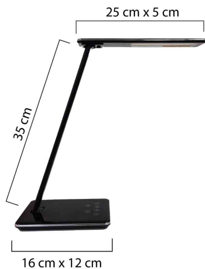
Lampe de bureau à LED LINKA

- que ce soit pour travailler, lire ou se détendre - la lampe fournit un éclairage sur mesure