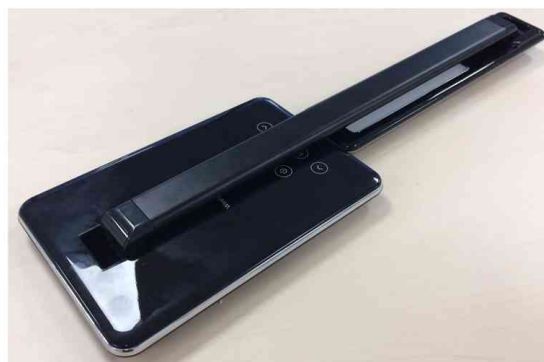
Visuel de référence: Rabattable et peu encombrante