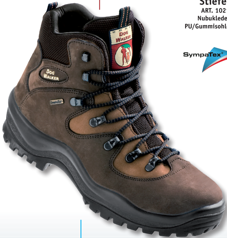
Stiefel ART. 1021 Nubukleder PU/Gummisohle