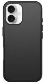
Black 77-96542 (Retail) 840304773626 77-96543 (ProPack) 840304773633