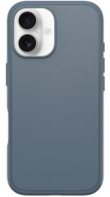
Bluetiful 77-96548 (Retail) 840304773688