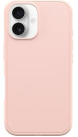
Ballet Shoes 77-96538 (Retail) 840304773589