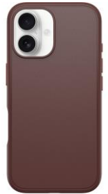
Union Station 77-96552 (Retail) 840304773725