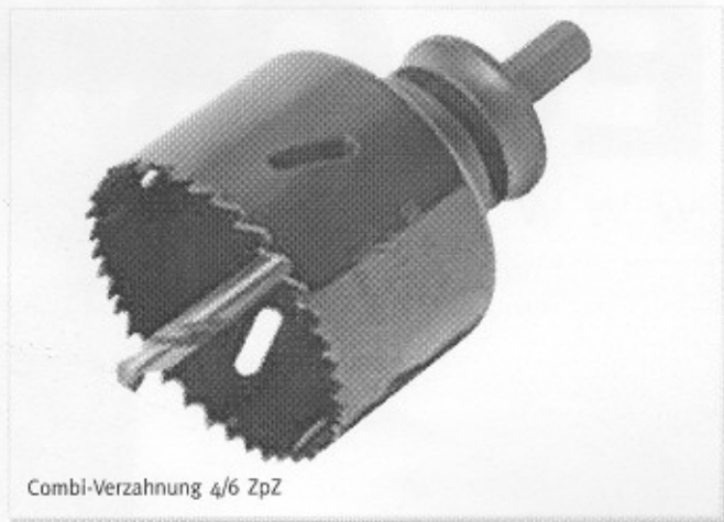
Combi-Verzahnung 4/6 ZpZ