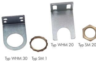
Typ WHM 30 Typ SM 1