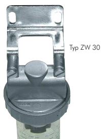
Typ ZW 30