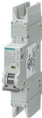
LEITUNGSSCHUTZSCHALTER 10KA, 1-POLIG, C, 20A NACH UL 489 - 277V