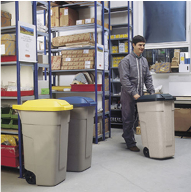
Anwendungsbeispiel: Platzierung des Rollcontainers -Separation- Deckel nicht im Lieferumfang (Art. 12325)