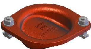
Deckel neue Bauart (Fertigungsdatum ab Januar 2017)) Deckel rund mit Befestigungslaschen, Außenfläche vertieft mit Düker- Beschriftung