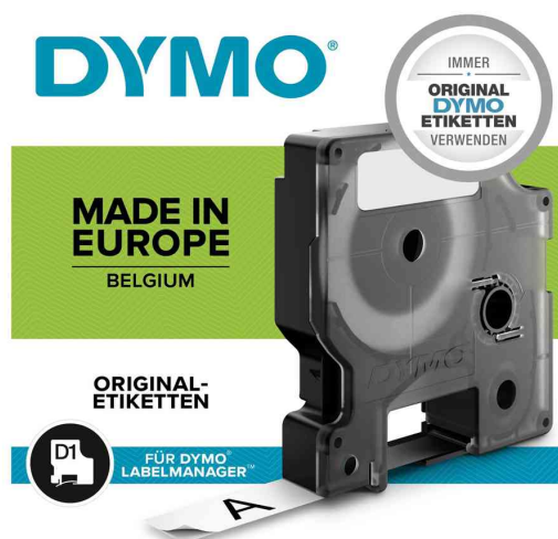
Visuel de référence: Ruban d'étiquette D1, emballage blister