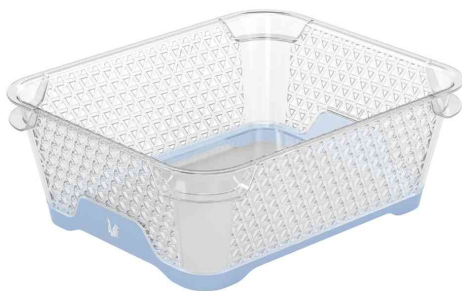
Stapelkörbchen "jonas" - DIN A6, nordic-blue

- zum Organisieren und Aufbewahren von Kleinteilen im Büro und zu Hause