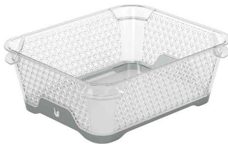
Stapelkörbchen "jonas" - DIN A6, nordic-grey