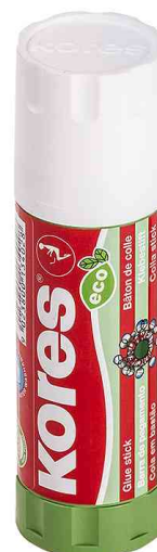
Bâton de colle "ECO", 40 g