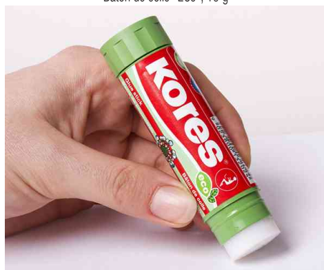
Visuel de référence: montre le produit en utilisation