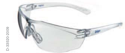
Schutzbrille Dräger X-pect 8320

Schön, wenn wirkungsvoller Schutz auch noch gut aussieht und modischen oder sportlichen Erwartungen entspricht. Die Brillen der Dräger X-pect 8000 Serie zeichnen sich durch ein modernes und sportliches Design aus und finden hohe Akzeptanz sowohl bei den Anwendern in Industrie und Handwerk als auch im privaten Umfeld.