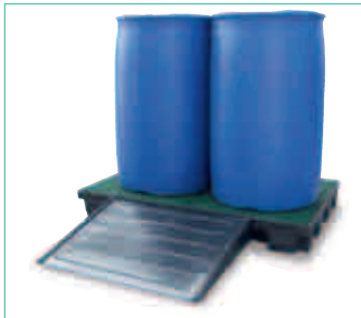
Auffahrrampe als Zusatzausstattung lieferbar