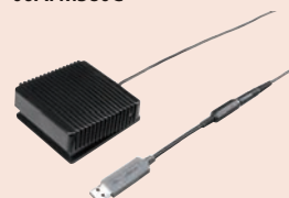
937179T és 06ADV384