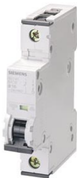
LEITUNGSSCHUTZSCHALTER 230/400V 10kA, 1-POLIG, C, 20A, T=70MM