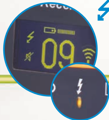
Der Sender arbeitet an abgeschalteten Stromkreisen und hat keinen Einfluss auf Fehlerstromschutzschalter oder empfindliche Geräte an aktiven Stromkreisen.