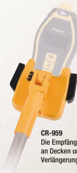
CR-959 Die Empfängerhalterung kann zur Suche an Decken und Fußböden mit einem Verlängerungsstab eingesetzt werden.