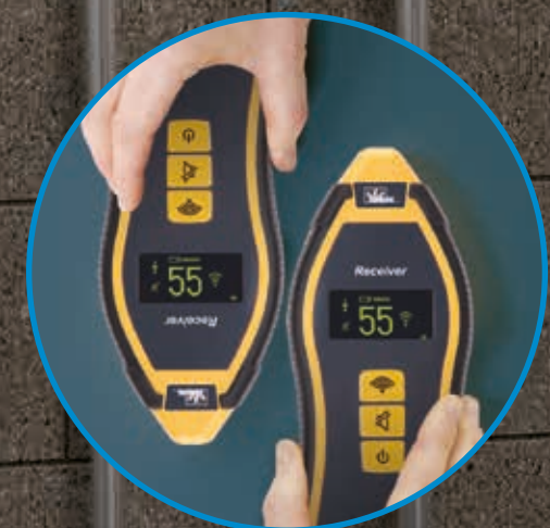
Revolutionäre Technologie im SureTrace 959 lässt die Anzeige in 90°-Schritten drehen, so dass Sie immer eine senkrechte Ergebnisanzeige bekommen. Selbst wenn der Empfänger nach unten zeigt, können Sie oben bleiben.