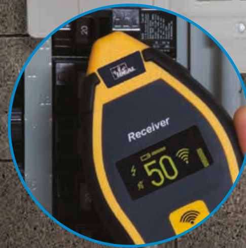
Im Breaker (Sicherungs-) Modus erkennt der Empfänger den Stromkreis, an den der Sender angeschlossen ist.