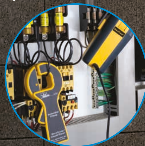
Die Induktions-Zange ermöglicht die Einspeisung eines Signals auf das Kabel ohne die Niederspannungssignale auf dem Stromkreis zu beeinflussen.