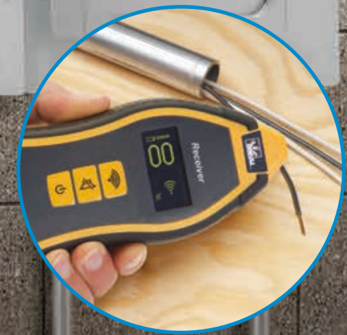
Einzelne Drähte können sortiert, offene Adern lokalisiert und Kurzschlüsse isoliert werden.