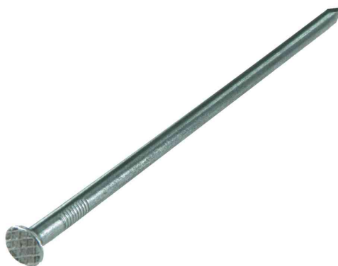
Visuel de référence: pointe, tête fraisée, brut