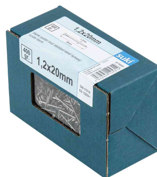
Visuel de référence: pointe, dans un carton