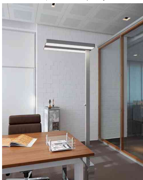
Visuel de référence : présente le produit en utilisation