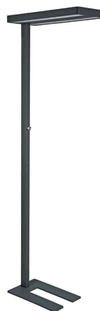
Lampadaire à LED MAULjava, noir