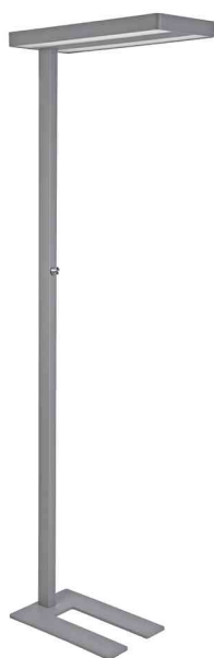
Lampadaire à LED MAULjava, argent